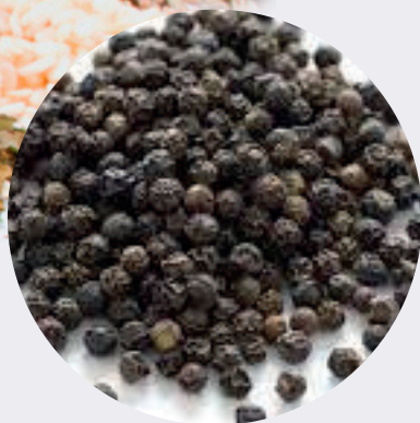
Pimienta Negra Grano