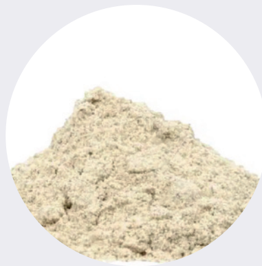
Pimienta Blanca Molida