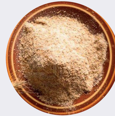
H. Trigo Integral