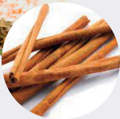
Canela en Rama (Sri Lanka)