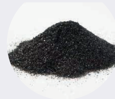
Sal Negra Himalaya 1KG ----- 1LB -----