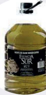
Aceite Extra Virgen Esencia del Sur 5 LTS $56,00