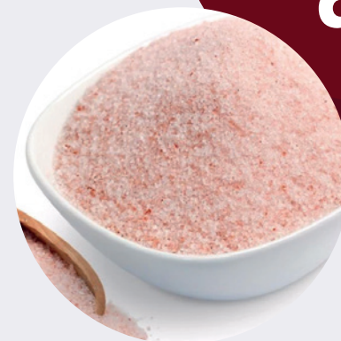
Sal Rosada Himalaya molida 1KG $7,00 1LB $3,75