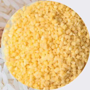
Cous Cous Arabe