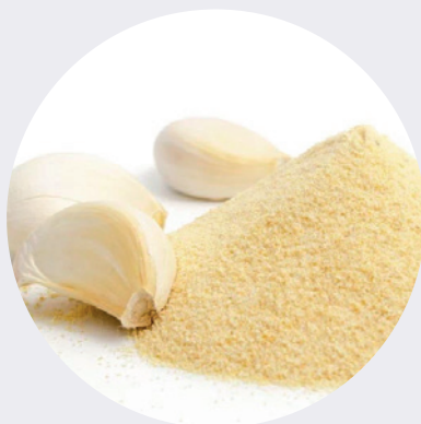
Ajo en polvo