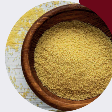
Cous Cous Italiano