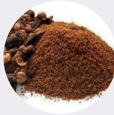
Clavo de Olor Molido