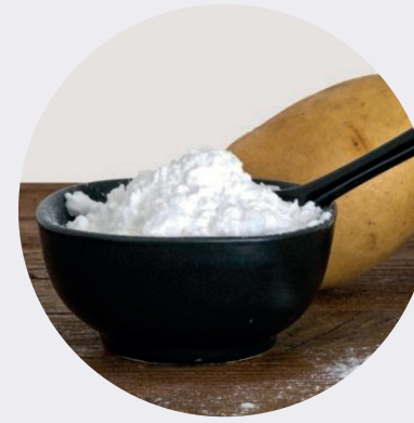
Almidón de Papa