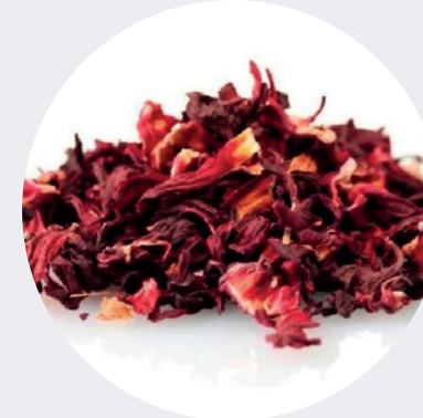
Flor de Jamaica Partida