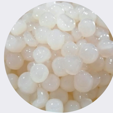
Tapioca Bolitas 1KG $9,00 1LB $4,50