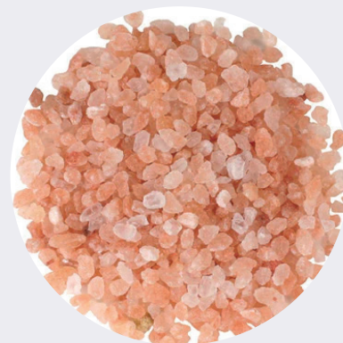
Sal Rosada Himalaya 1KG $6,50 1LB $3,25