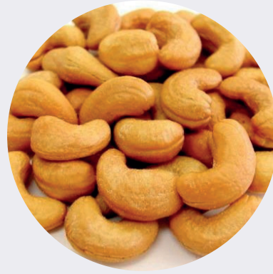
Cashew con Sal