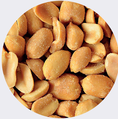
Maní Tostado con Sal