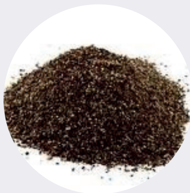
Pimienta Negra Molida