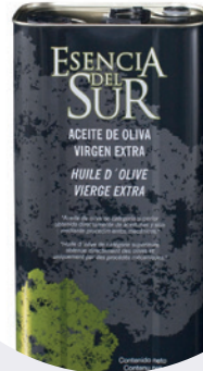
Aceite Extra Virgen Esencia del Sur 3 LTS $34,50