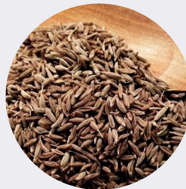
Comino en Grano