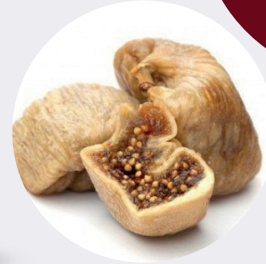
Higo Turco Deshidratado