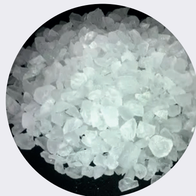
Sal Gruesa Marina 1KG $2,25 1LB $1,20