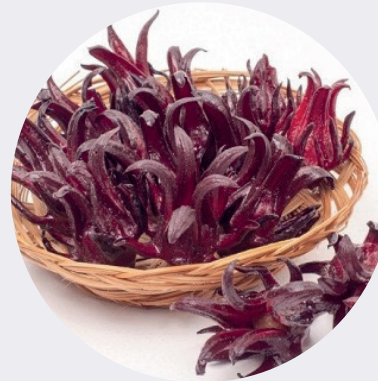
Flor de Jamaica Entera