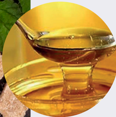
Miel de Abeja