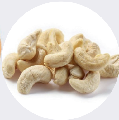
Cashew sin Sal