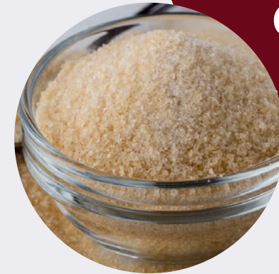
Gelatina sin Sabor 1KG $18,00 1LB $9,00