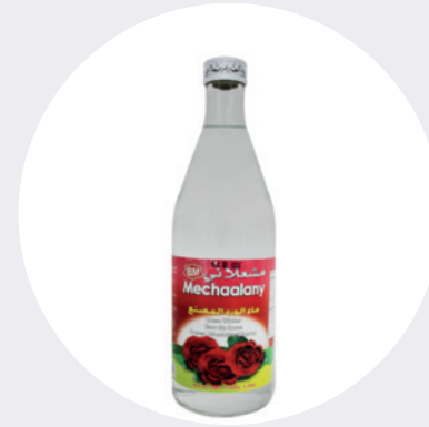
Agua de Rosas 375 ML $4,99