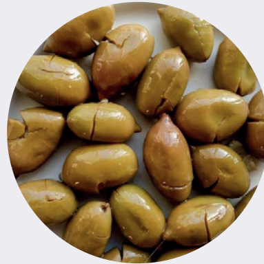
Aceituna verde Griega S/P