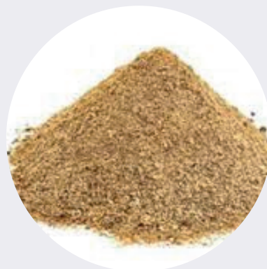
Anís Español Molido