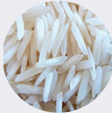
Arroz Indu Basmati (Importado)