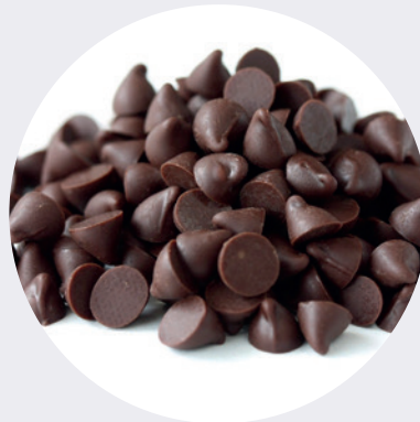
Gotas 60% Amargo