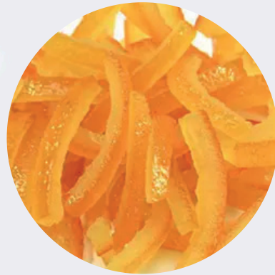
Cáscara de Naranja