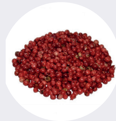
Pimienta Roja Grano