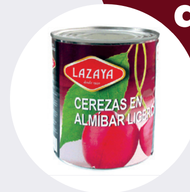
Cereza sin tallo