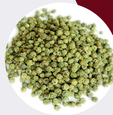
Pimienta Verde Grano