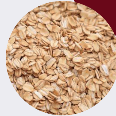
Avena Hojuela Entera