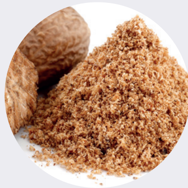
Nuez Moscada Molida