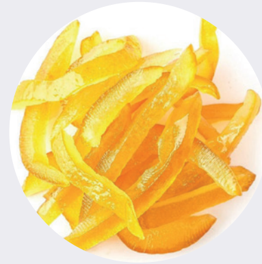
Cáscara de Limón