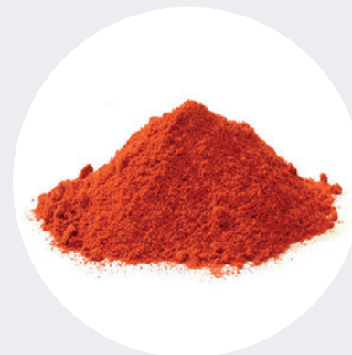
Ají Peruano Polvo