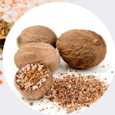
Nuez Moscada Entera