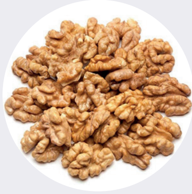
Nuez Pelada Extra Light