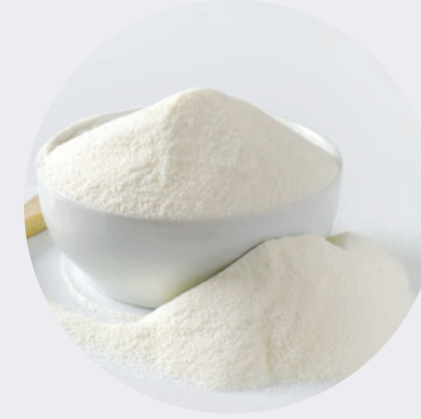
Leche Entera en Polvo 25KG $172,50