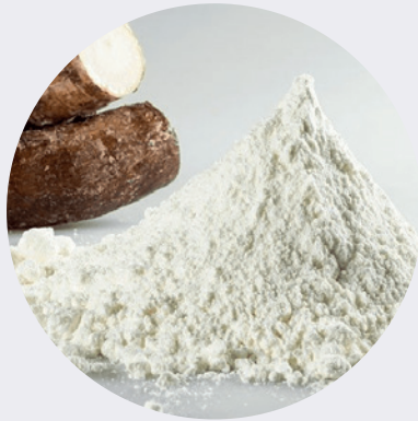
Almidón de Yuca