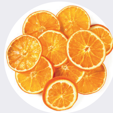
Naranja en Rodaja