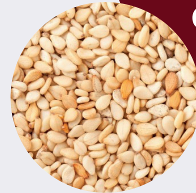
Ajonjolí con Cáscara