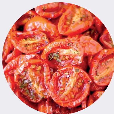
Tomate Italiano Deshidratado