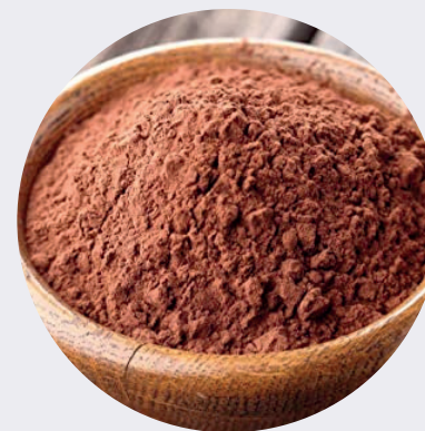
Cacao en Polvo 100%