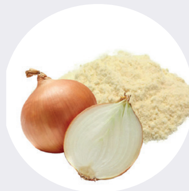
Cebolla en Polvo