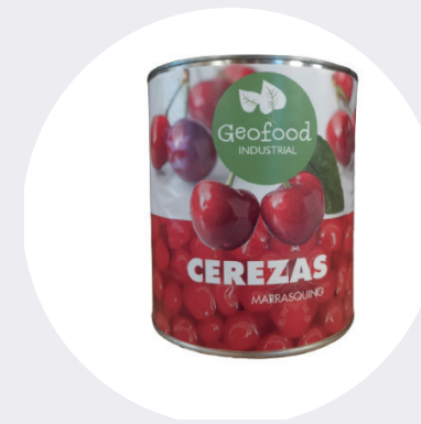
Cereza con tallo