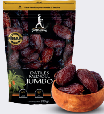
Dátiles Medjoul Jumbo