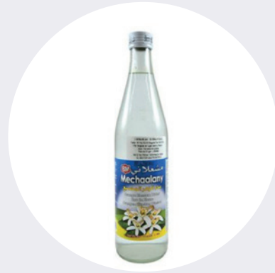
Agua de Azahares 375 ML $4,99