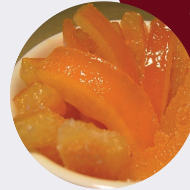
Cáscara de Mandarina