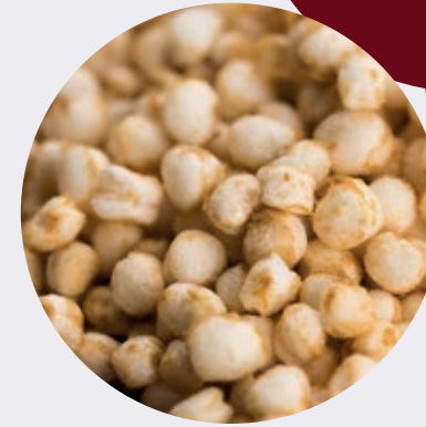
Quinoa Insuflada Endul. Org.