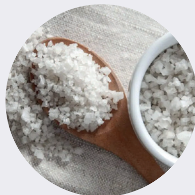
Sal Parrillera 1KG $5,25 1LB $3,00