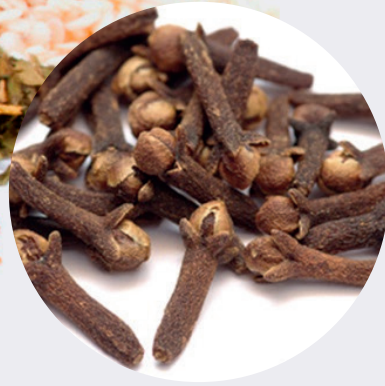
Clavo de Olor