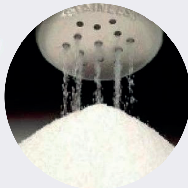
Sal Fina 1KG $0,65