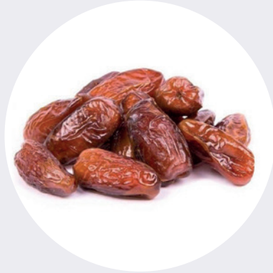
Dátiles Deglet Nour