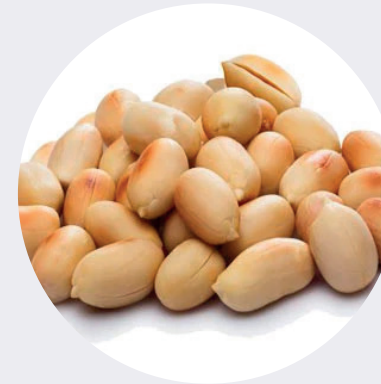
Maní Tostado sin Sal