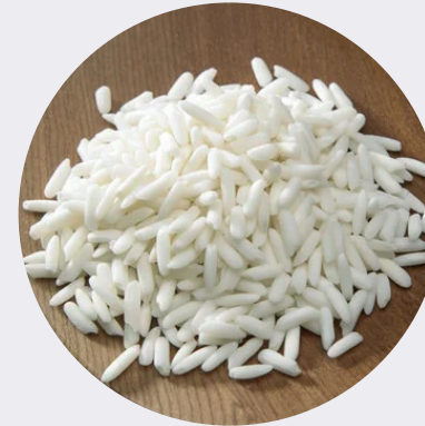
Arroz Botan (Japonés)