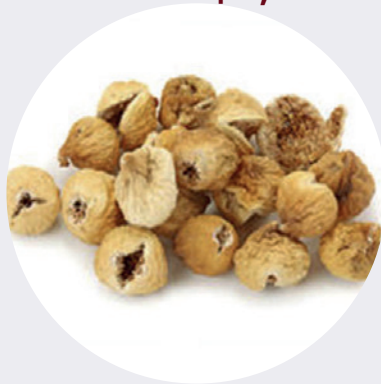
Higo Persa Deshidratado