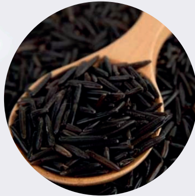
Arroz Salvaje (Importado)