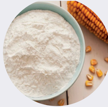
Almidón de maíz