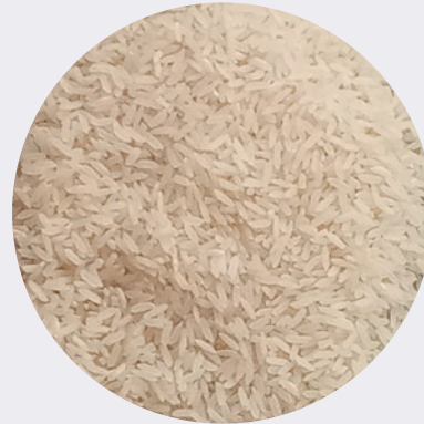
Arroz Envejecido Especial