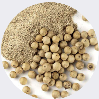
Pimienta Blanca Grano