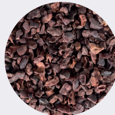
Nibs de Cacao