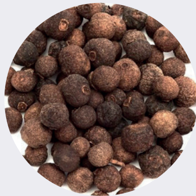
Pimienta Dulce Grano