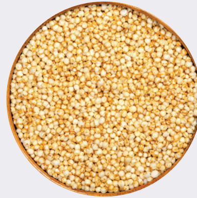
Quinoa Insuflada Natural Org.