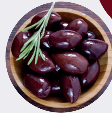
Aceituna Negra Griega con pepa