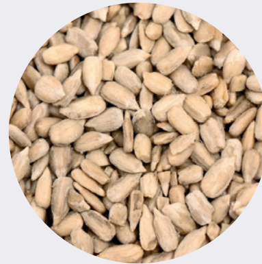
Semillas de Girasol